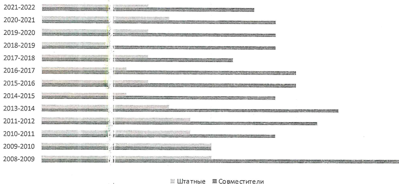
Диаграмма. Соотношение штатных педагогов и совместителей

В учреждении работают 15 педагогов. Из них имеют образование: